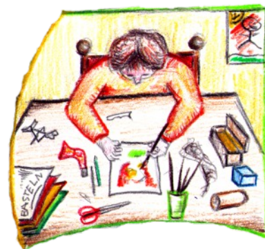
Betreuung der Grundschul Kinder ohne Mittagessen.

Mo. - Fr. 07:15 - 08:15 Uhr u. 11:55 - 13:00 Uhr