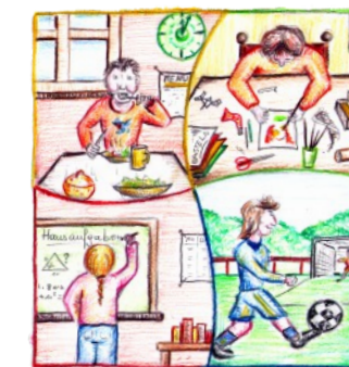
Betreuung der Grundschul Kinder von Vormittag bis Nachmittag inklusive Mittagessen und Hausaufgabenbetreuung.